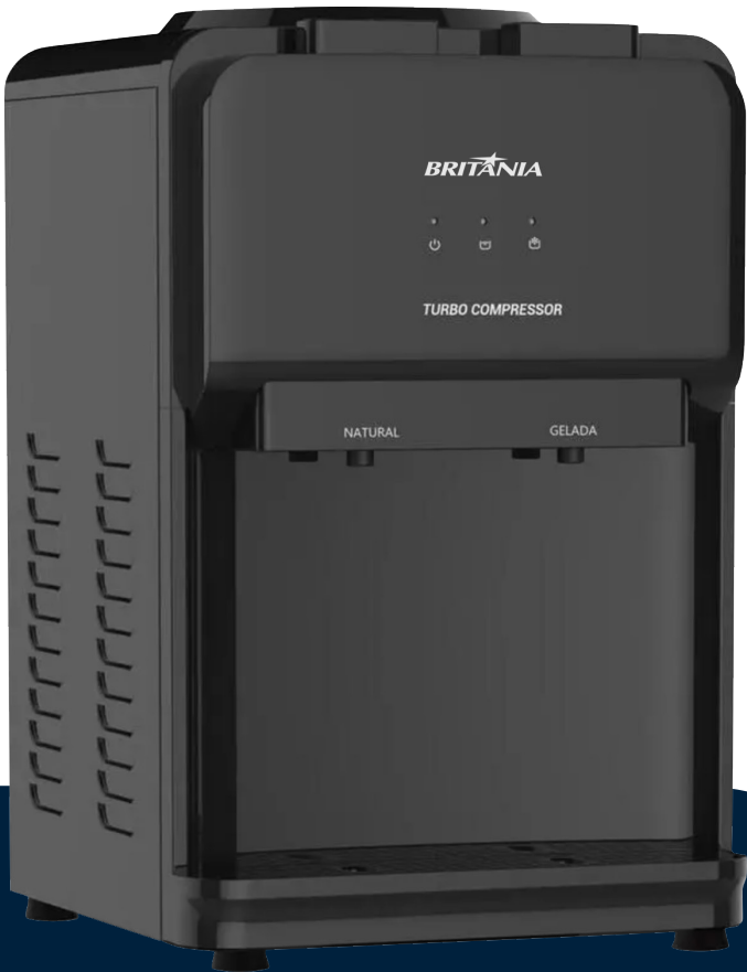
Imágenes meramente ilustrativas