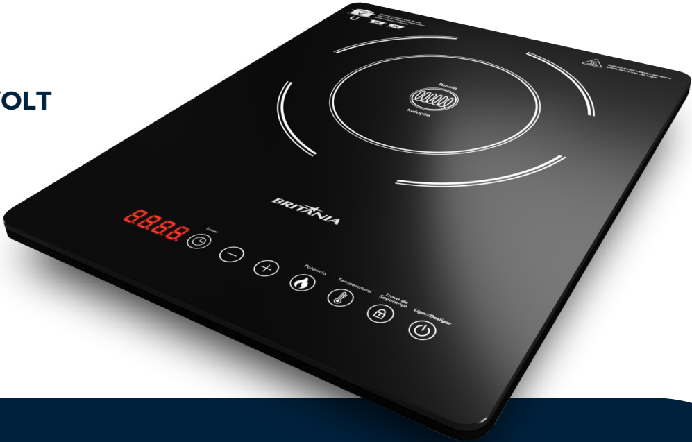
Imágenes meramente ilustrativas