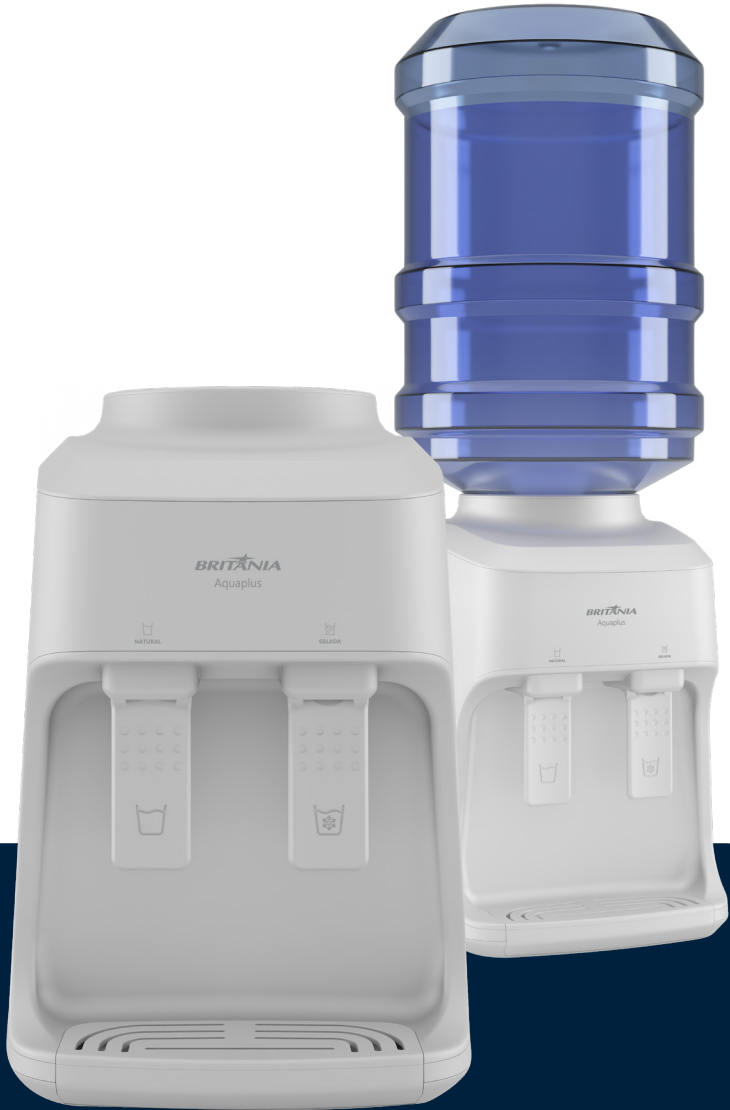
Imágenes meramente ilustrativas