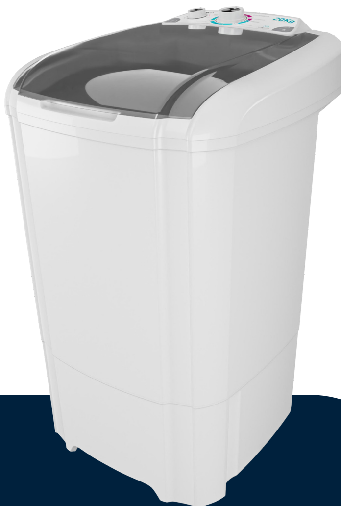
Imágenes meramente ilustrativas