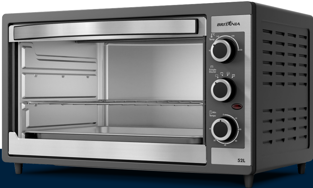
Imágenes meramente ilustrativas