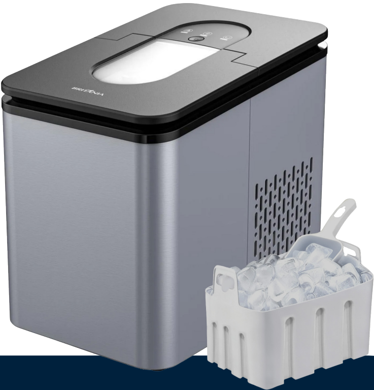
Imágenes meramente ilustrativas