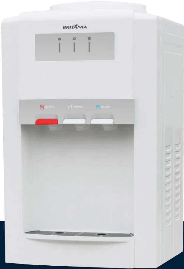
Imágenes meramente ilustrativas