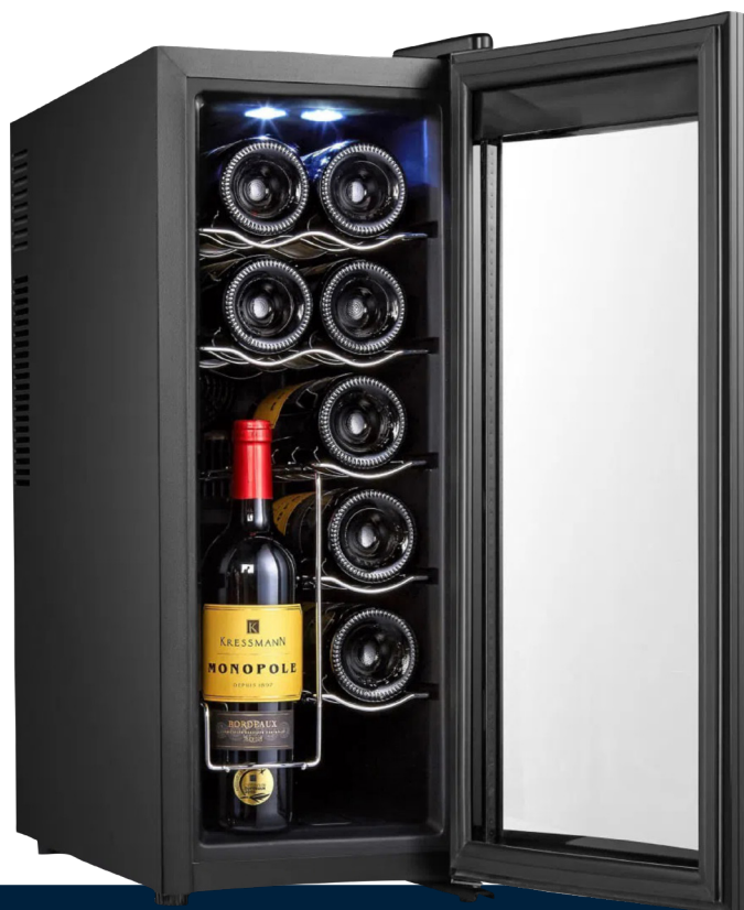
Imágenes meramente ilustrativas