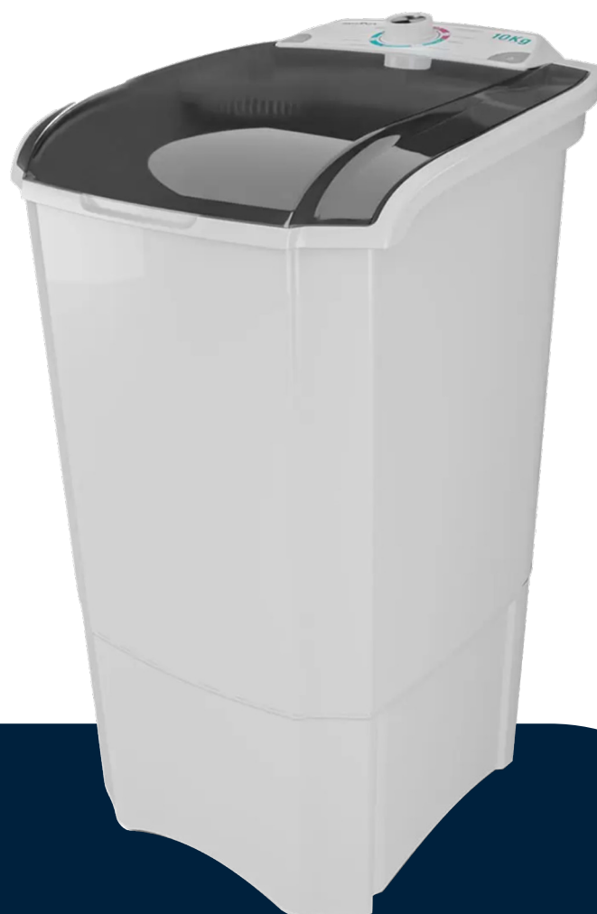
Imágenes meramente ilustrativas