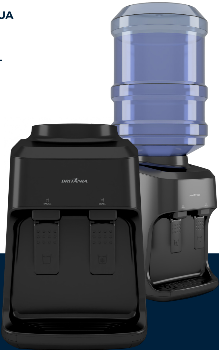
Imágenes meramente ilustrativas