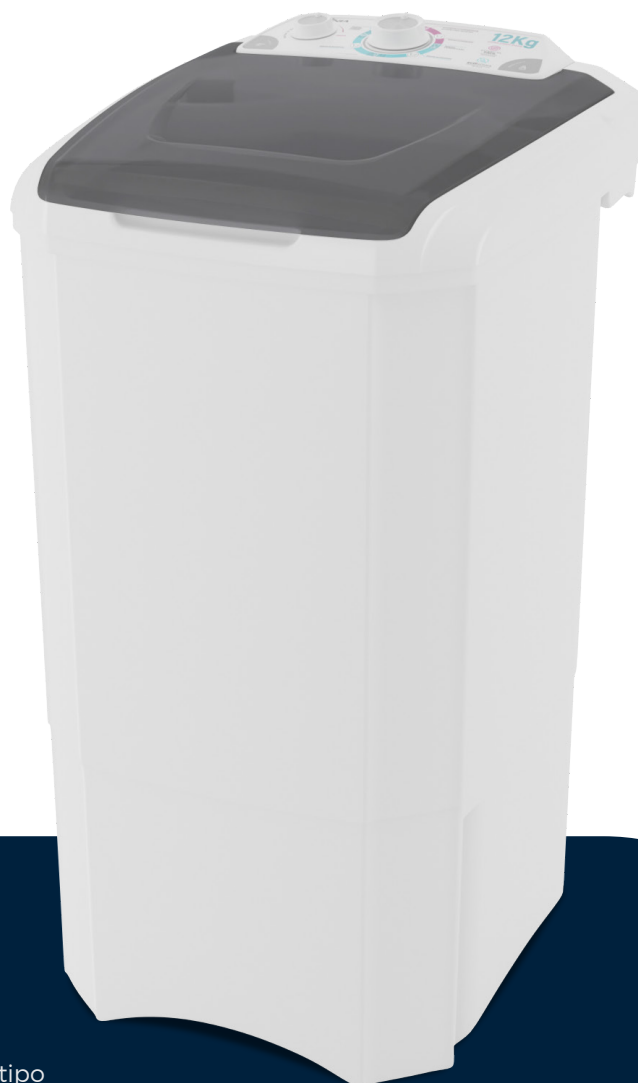
Imágenes meramente ilustrativas