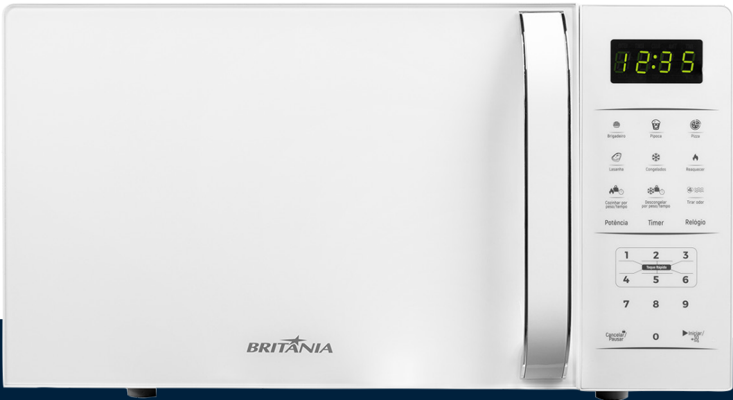
Imágenes meramente ilustrativas