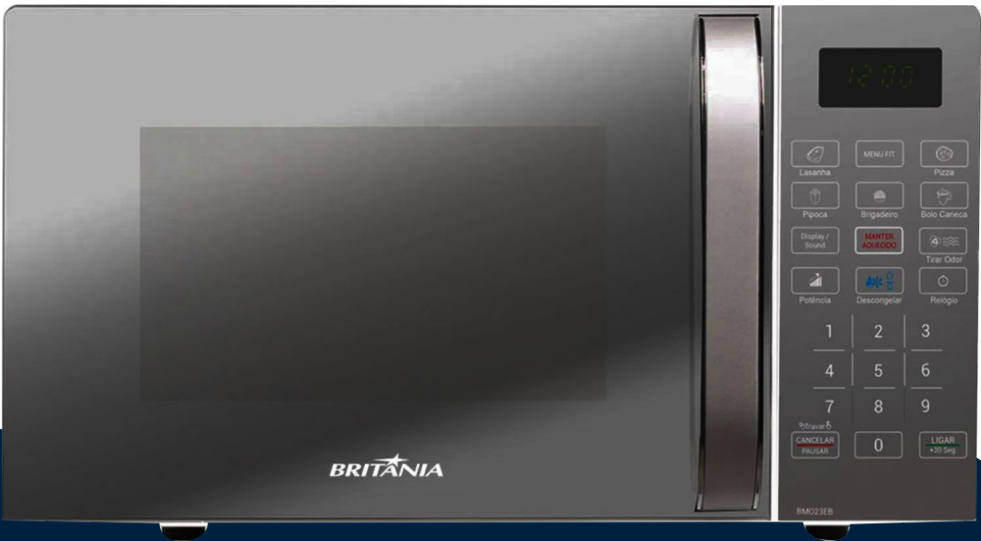
Imágenes meramente ilustrativas